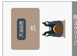
※セッティングイメージ

※著作権や肖像権等の確認が必要な画像や動画資料については各参加社様においてご確認下さい。